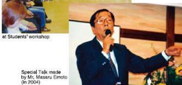
at Students' workshop