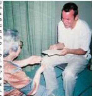
Late Chiyoko Yamaguchi